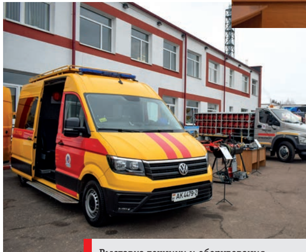
Выставка техники и оборудования, организованная на базе ПУ «Полоцкгаз»