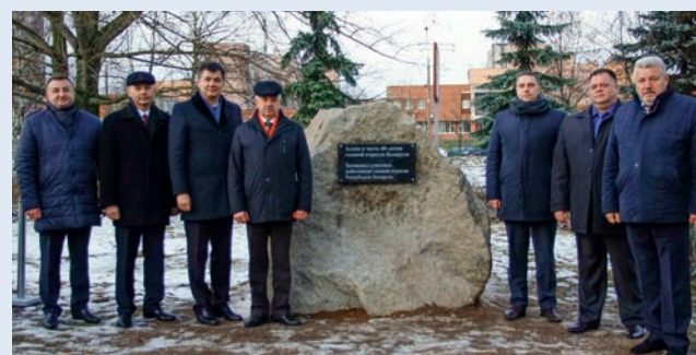
У памятного знака «Аллея, заложенная в честь 60-летия газовой отрасли Беларуси»

ли газоснабжающих организаций объединения. Как отметили участники мероприятия, новая аллея должна стать напоминанием подрастающему поколению белорусов о вкладе газовиков в их комфортную жизнь. ■