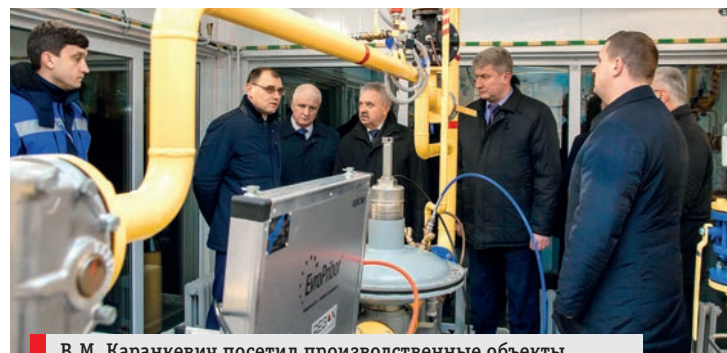
В.М. Каранкевич посетил производственные объекты ПУ «Брестгаз»

По словам министра, решение проблемы надежности, экономичности и безопасности эксплуатации систем газоснабжения тесно связано с подготовкой квалифицированных кадров, и в этом плане вполне актуальным и своевременным стало строительство учебно-тренировочного полигона на базе ПУ «Брестгаз». «Создание современной тренировочной базы – это работа на перспективу. Хотелось бы, чтобы в каждом регионе обеспечивались необходимые условия для теоретической и практической подготовки инженерно-технического и рабочего персонала с учетом новых веяний и в целях безопасного осуществления всех видов деятельности», – отметил В.М. Каранкевич во время посещения объекта.