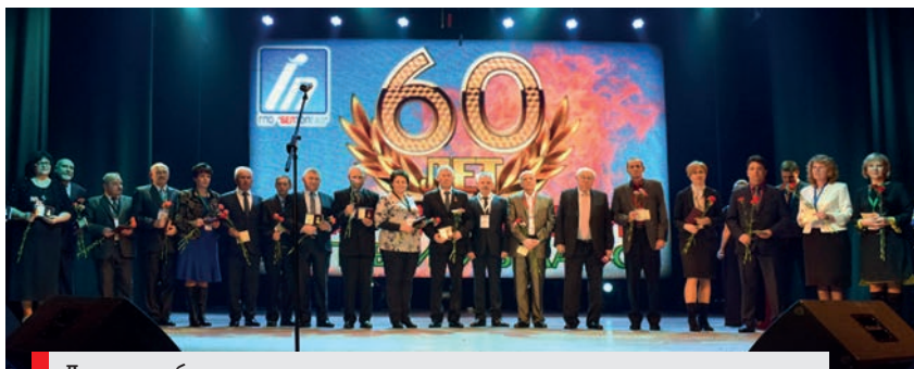
Лучшие работники и ветераны отрасли получили заслуженные награды