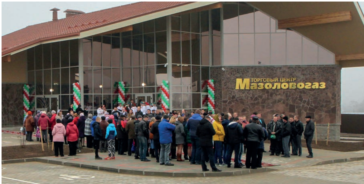
Жители и гости аг. Мазолово оценили преимущества нового торгового центра

В сознании многих из нас понятия «высокие технологии», «интернет вещей», «информатизация», «роботизация» не совместимы с понятием «сельская местность». Этот стереотип легко рушится, стоит только побывать в агрогородке Мазолово.