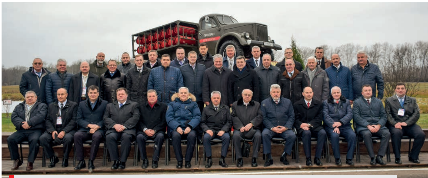
Участники торжественного мероприятия, посвященного 60-летию газовой отрасли Беларуси. 6 ноября 2018 года, г. Полоцк

В этот день почетными грамотами и благодарностями ГПО «Белтопгаз», Министерства энергетики Республики Беларусь, РК Профсоюза Белэнерго-топгаз, юбилейными знаками в честь