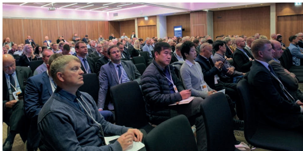
Белорусская делегация в числе участников конференции Балтийского торфяного форума. 11 октября 2018 года, г. Тарту

зид на добычу торфа на площади 27 153 га, в промышленной разработке находится около 10,9 % от всех запасов торфа республики (0,4 % мировых запасов). В настоящее время эксплуатируется 18 000 га площадей. При сохранении ежегодных объемов добычи на уровне текущего года запасов торфяного сырья на торфяных месторождениях, лицензированных для добычи, хватит на ближайшие 75 лет. Ожидается, что по итогам работы организаций торфяной отрасли Латвии в 2018 году объем производства торфяной продук-