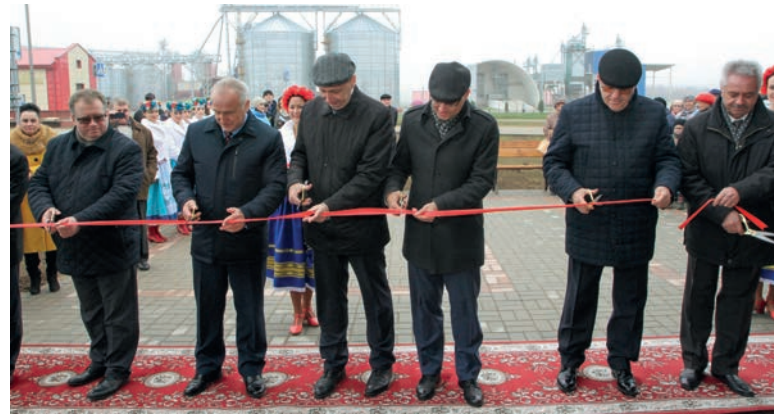
В торжественной обстановке была перерезана красная лента, символизирующая начало деятельности нового современного объекта в инфраструктуре поселка