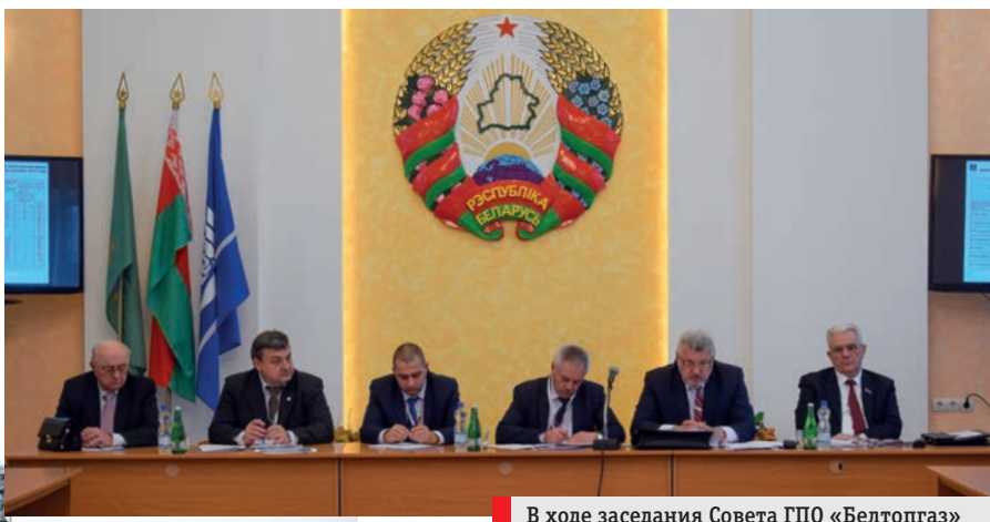
В ходе заседания Совета ГПО «Белтопгаз»