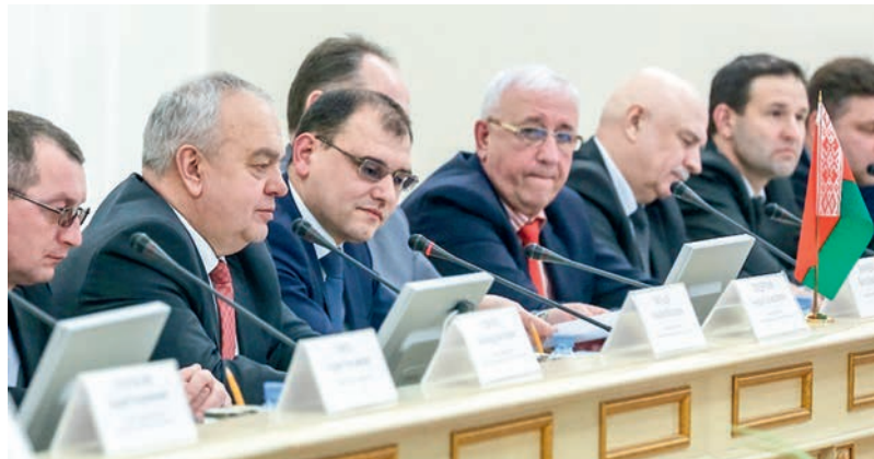
Белорусская делегация приняла участие в совместных встречах по вопросам торгово-экономического и научно-технического сотрудничества

группы по торгово-экономическому и научно-техническому сотрудничеству между Тюменской областью Российской Федерации и Республикой Беларусь, включающий в себя пункты по развитию взаимодействия в торфяной отрасли. В результате проведенных переговоров представителями торфяной отрасли Беларуси