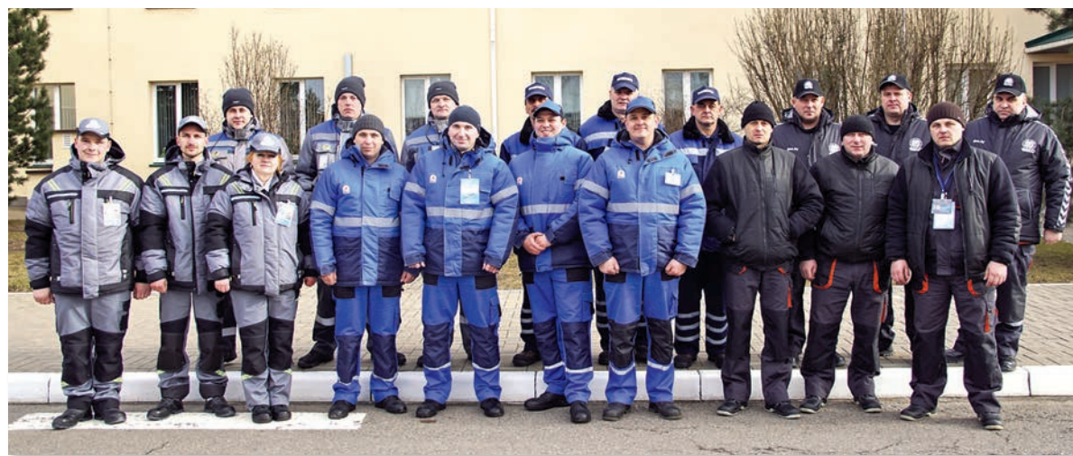
Участники республиканского смотра-конкурса на звание «Лучшая бригада по техническому обслуживанию газоиспользующего оборудования ГПО «Белтопгаз» 2019 года»

изобретательными оказались УП «Витебскоблгаз» и РПУП «Гомельоблгаз», за что и были награждены дипломами ГПО «Белтопгаз».