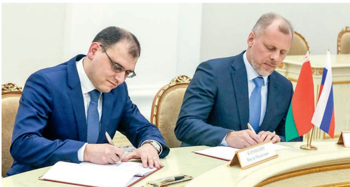
Заместитель губернатора Тюменской области В.Н. Чейметов и министр энергетики Беларуси В.М. Каранкевич скрепили своими подписями протокол заседания рабочей группы по торгово-экономическому и научно-техническому сотрудничеству Республики Беларусь и Тюменской области

Республика Беларусь и Тюменская область Российской Федерации продолжают налаживать торгово-экономические и научно-технические связи. Так, 19-20 февраля белорусская делегация во главе с министром энергетики Виктором Михайловичем Каранкевичем посетила Тюменскую область для обсуждения возможных вариантов сотрудничества.