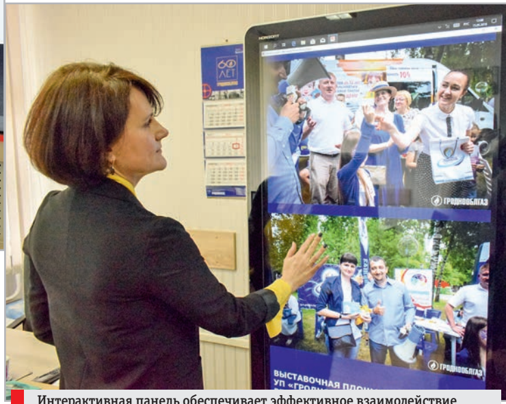
Интерактивная панель обеспечивает эффективное взаимодействие и вовлеченность посетителя в транслируемый контент в режиме реального времени