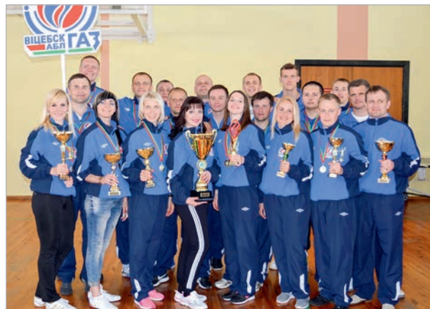
Спортивная жизнь работников предприятий «Витебскоблгаз» и «МИНГАЗ»: яркие моменты 2018 года

Проведение масштабной спортивно-массовой работы позволяет выявлять лучших спортсменов и комплектовать из них сборную команду