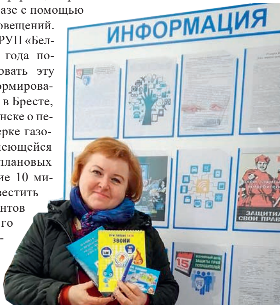
15 марта в рамках празднования Дня потребителя в ряде структурных подразделений УП «Брестоблгаз» проведены акции с вручением посетителям памяток и сувениров

пользователя. А в Кобрине оценивают работу пяти счетчиков производства СП «БэмКромГаз». В этих приборах встроен модем, посредством которого данные передаются по радиоканалу. Если «дистанционка» хорошо зарекомендует себя и автоматизация будет экономически целесообразна, это позволит сократить штат контролеров и иметь оперативную информацию о потреблении газа абонентами области.