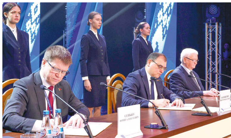
Церемония подписания Генерального соглашения между Правительством Республики Беларусь, республиканскими объединениями нанимателей и профсоюзов на 2025–2027 годы

Профсоюзные активы, представители органов власти, отраслевых министерств и ведомств, крупнейших предприятий страны собрались 31 января на X съезде Федерации профсоюзов Беларуси. Среди гостей – представители зарубежных профцентров, с которыми профсоюзы Беларуси сотрудничают не первый год. Всего – порядка 500 человек.