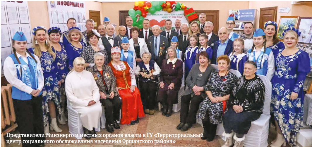
Представители Минэнерго и местных органов власти в ГУ «Территориальный центр социального обслуживания населения Оршанского района»

В нашей стране много добрых новогодних традиций. Одна из них – еще достаточно молодая, но такая необходимая – Республиканская благотворительная акция «От всей души». Организованная по инициативе Главы государства, она призвана окружить вниманием и заботой пожилых граждан, оказавшихся в сложной жизненной ситуации, которые остро испытывают потребность общения и внимания особенно в новогодние праздники.