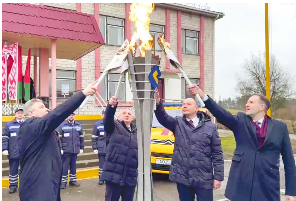
23 января в ознаменование прихода голубого топлива был зажжен символический факел

Сегодня наша страна является одной из самых газифицированных в мире. По современной газораспределительной системе природный газ поступает во все города и районные центры. Дело осталось только за малыми сельскими населенными пунктами, такими как, например, агрогородок Хутор Светлогорского района. Но и эта задача, как видим, успешно решается руководством нашей страны и отрасли.