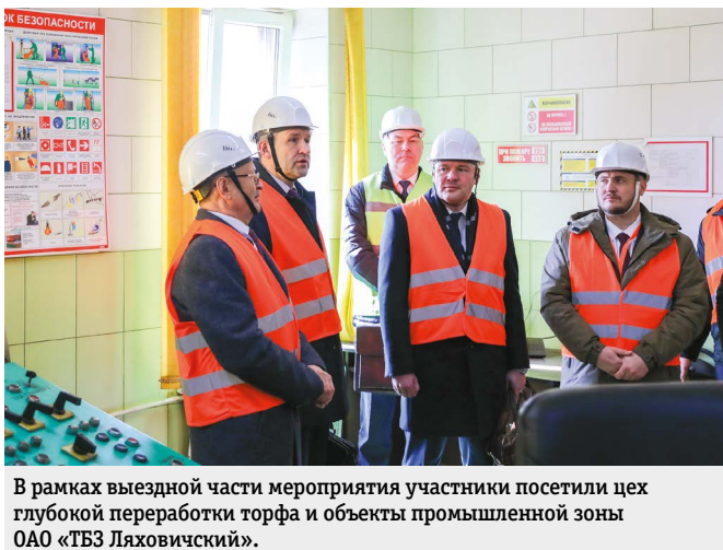
В рамках выездной части мероприятия участники посетили цех глубокой переработки торфа и объекты промышленной зоны ОАО «ТБЗ Ляховичский».