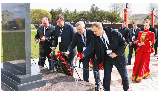
Отдавая дань памяти подвигу белорусского народа, участники заседания возложили цветы к Памятнику жителям колхоза, погибшим в годы Великой Отечественной войны.

Согласно приведенным данным, объем поставок торфяной сушенки на ОАО «Красносельскстройматериалы» ежегодно увеличивается: в 2025 году – 130,4 тыс. т, в плане на 2026 год – 144,5 тыс. т.