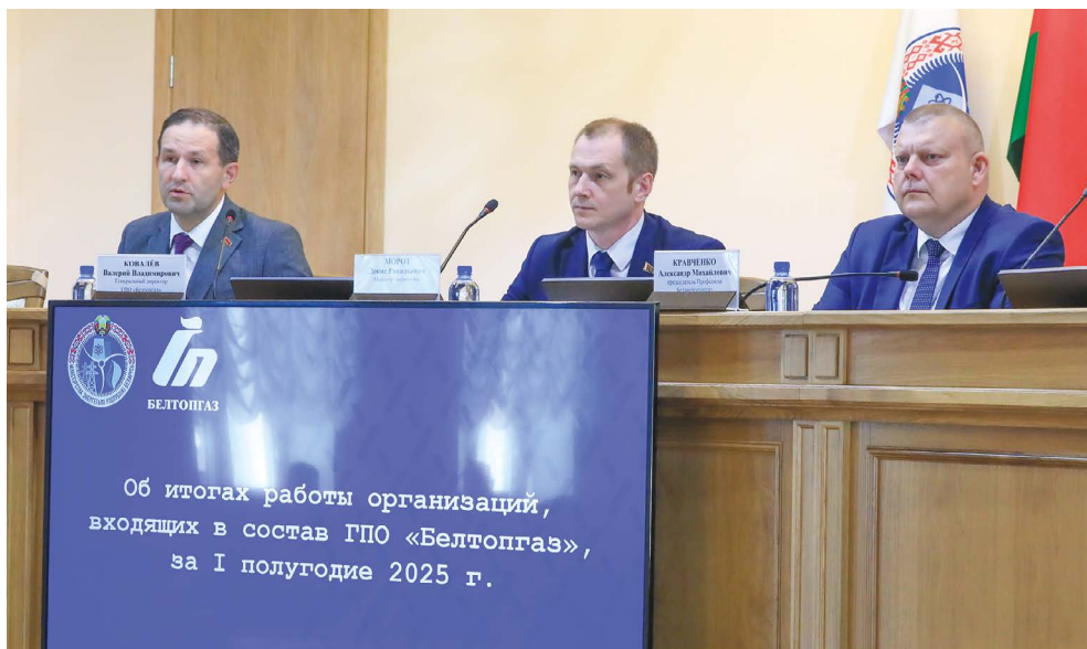
Об итогах работы организаций, входящих в состав ГПО «Белтопгаз», за I полугодие 2025 г.

В рамках реализации Государственной программы «Энергосбережение» на 2021–2025 годы за отчетный период обеспечено выполнение всех установ-