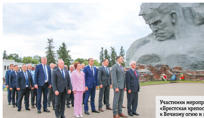
Участники мероприятия посетили мемориальный комплекс «Брестская крепость-герой», где возложили цветы к Вечному огню и почтили память погибших в годы войны