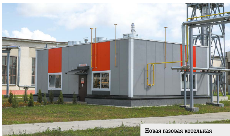
Новая газовая котельная