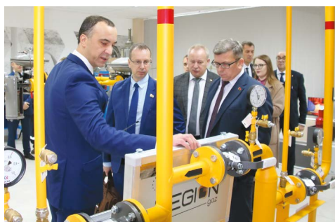
Участники семинара посетили ПУ «Брестгаз» и ПУ «ПВД» УП «Брестоблгаз», где ознакомились с производственной базой и производимой продукцией

но и других технических вузов страны, колледжей. За 2 месяца нынешнего учебного года реализован ряд образовательных программ для 300 студентов БрГТУ и 202 студентов из других вузов страны.