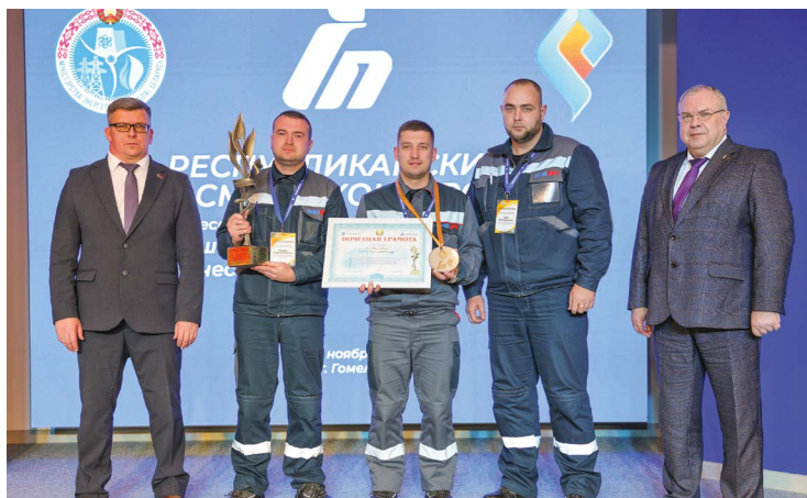
Команда ПУ «Могилевгаз» РУП «Могилевоблгаз» признана лучшей бригадой по техническому обслуживанию ГРП 2025 года

Определены лучшие бригады ГПО «Белтопгаз» по техническому обслуживанию ГРП. Семь команд газоснабжающих организаций объединения боролись за звание победителя в Республиканском смотре-конкурсе профессионального мастерства, проходившем 25-26 ноября на базе ПУ «Гомельгаз» РПУП «Гомельоблгаз».