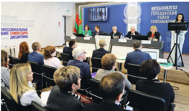
На этапе конкурса «Визитная карточка» участники представляют свои презентации

Редакция поздравляет победителей и желает всем участникам конкурса новых достижений на пути к профессиональным вершинам!