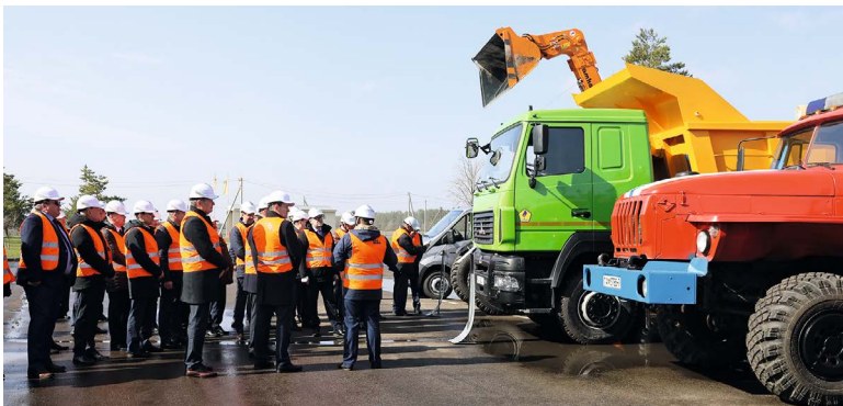
Участники рабочей встречи посетили выставку специализированной техники, ознакомились с производственной базой филиала «ТБЗ «Сергеевичское» УП «МИНГАЗ»

«40% нашей торфопродукции топливного назначения поставляется трем цементным заводам. Потребителями также являются котельные и теплоисточники Министерства энергетики, системы жилищно-коммунального хозяйства, 200 тыс. индивидуальных жилых домов отапливаются торфяным топливом. Количество таких потребителей растет, и при этом важно, что торф – наш национальный продукт, местный вид топлива. Его доля