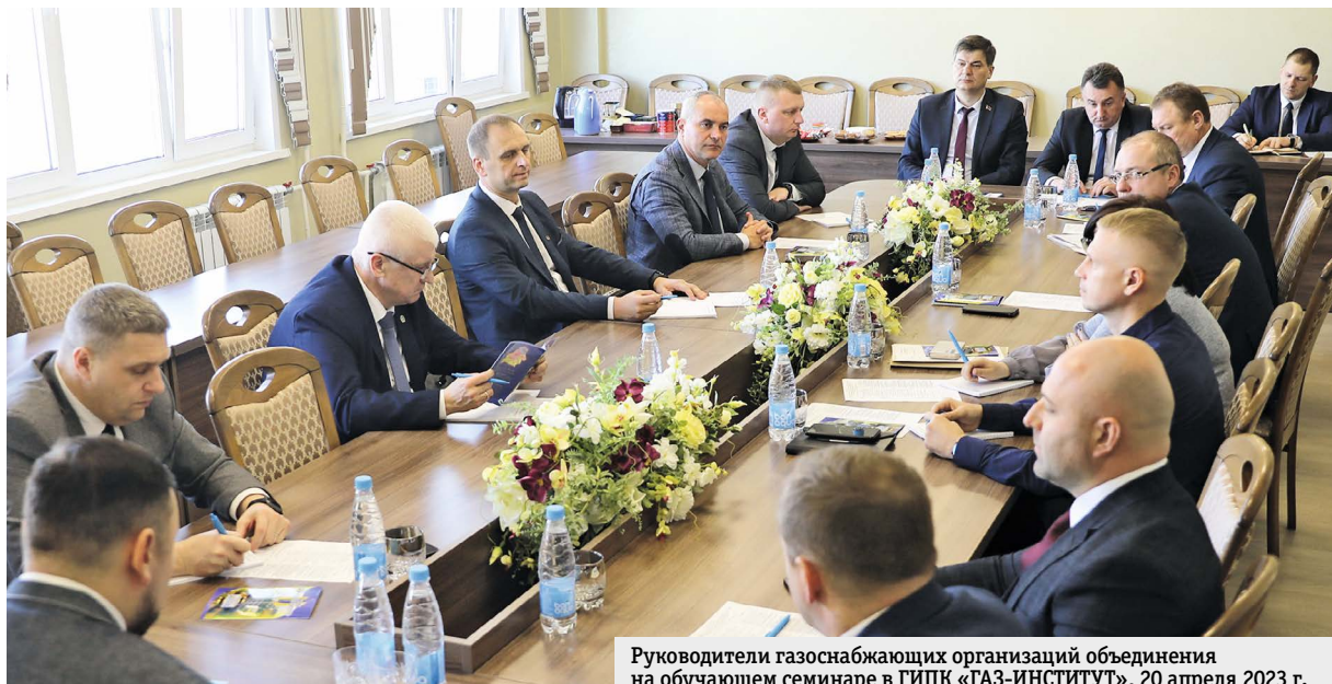
Руководители газоснабжающих организаций объединения на обучающем семинаре в ГИПК «ГАЗ-ИНСТИТУТ», 20 апреля 2023 г.

В апреле ГИПК «ГАЗ-ИНСТИТУТ» приступил к проведению цикла обучающих мероприятий для руководящего состава организаций ГПО «Белтопгаз» в рамках целевых курсов «Эффективные управленческие решения в сфере обеспечения безопасности по направлениям Директивы № 1».