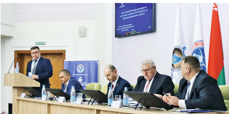
В ходе заседания рассмотрены итоги работы с обращениями граждан и юридических лиц в 2022 году

«Мы можем констатировать, что проделана большая работа, открыты современные сервисные центры, реализуется принцип «одного окна», применяются современные