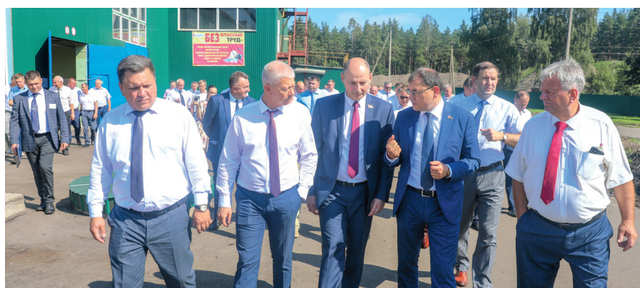
Участники мероприятия ознакомились с производственной базой торфозавода и его основными производственными показателями