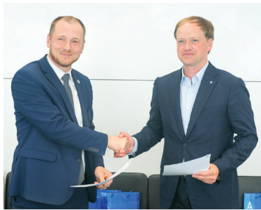
Подписание Протокола по итогам рабочего совещания, 25 августа

2 августа в ходе визита делегации Минэнерго Беларуси в Ленинградскую область в г. Санкт-Петербурге состоялись переговоры заместителя министра энергетики Д.Р. Мороза и заместителя председателя Правительства Ленинградской области О.М. Малащенко. В частности, рассмотрено сотрудничество в проектах по созданию новых и реконструкции действующих источников теплоснабжения, а также по развитию газоснабжения и газификации российского региона.