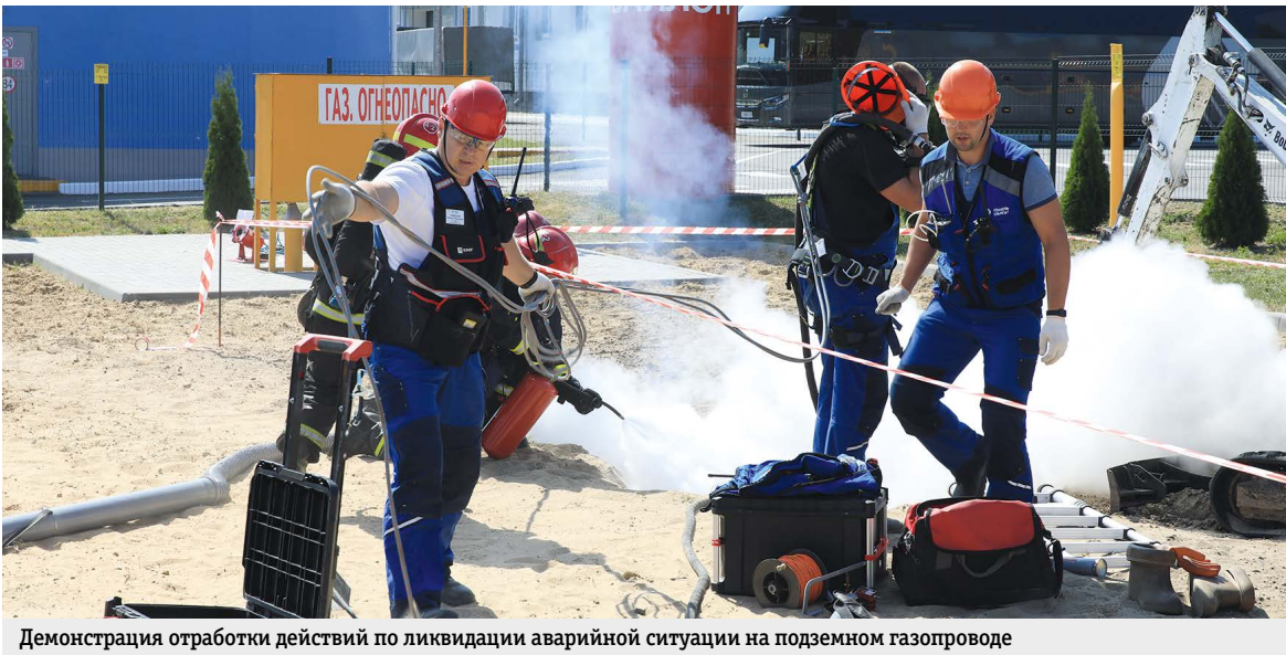
Демонстрация отработки действий по ликвидации аварийной ситуации на подземном газопроводе