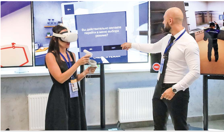
Любой из участников пресс-тура мог ознакомиться с возможностями виртуального тренажера

средствами. Здесь с помощью симулятора «Работник газовой службы» – собственной разработки офиса цифровизации объединения «Белтопгаз» – газовики могут в условиях виртуальной реально-