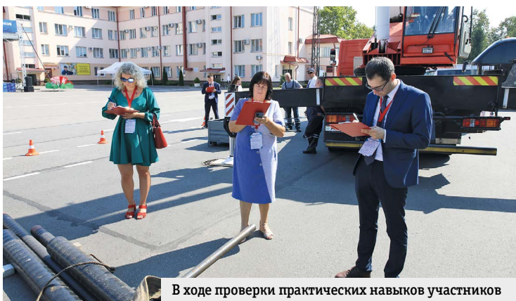
В ходе проверки практических навыков участников