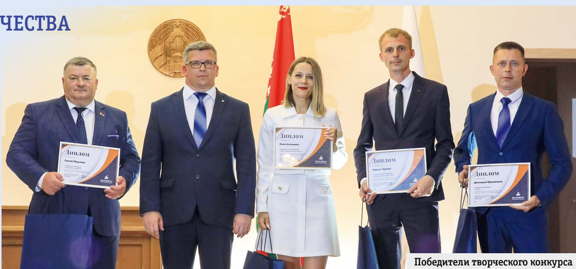
Победители творческого конкурса

К участию в конкурсе, организованном в целях популяризации основных направлений деятельности в отрасли и развития творче-