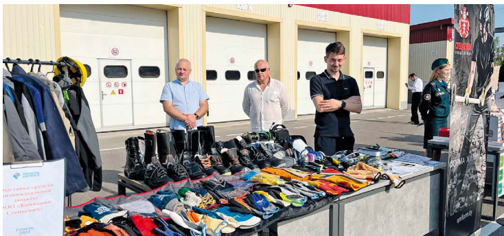
Выставка новшеств и достижений в сфере охраны труда и пожарной безопасности