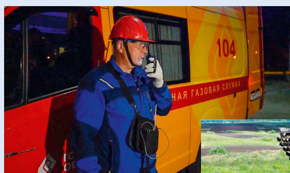
Видеономинация «В центре внимания – человек труда»

ских способностей сотрудников, были приглашены работники аппарата управления ГПО «Белтопгаз» и предприятий, входящих в его состав. Победители определены в четырех основных номинациях: фото- и видеоработы,