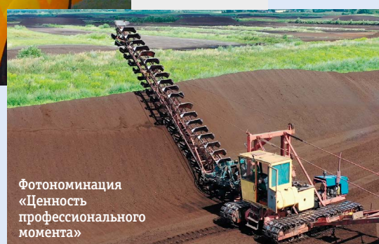
Фотониминация «Ценность профессионального момента»

ских способностей сотрудников, были приглашены работники аппарата управления ГПО «Белтопгаз» и предприятий, входящих в его состав. Победители определены в четырех основных номинациях: фото- и видеоработы,