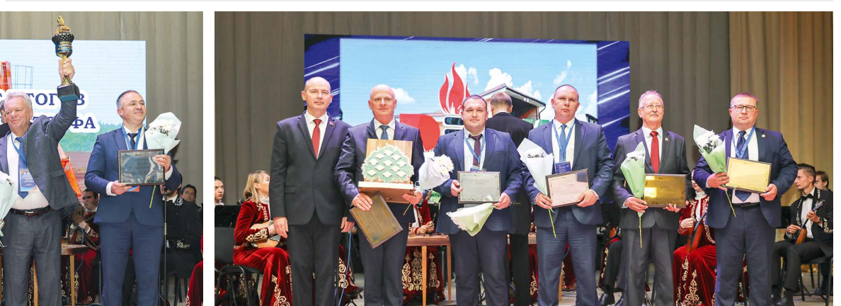
Победители республиканского смотра-конкурса производственных баз организаций торфяной промышленности ГПО «Белтопгаз» 2023 года

бра, созидания, а нашей торфяной промышленности – дальнейшего развития и процветания».