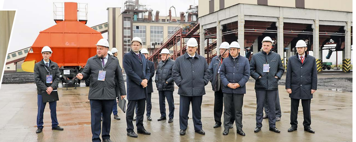
Гости посетили объекты промышленной зоны и ознакомились с работой брикетного завода ОАО «Торфопредприятие Днепровское». За последние три года здесь проведена поэтапная масштабная модернизация, обновлены основные производственные фонды, технологическое оборудование.