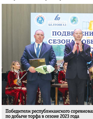
Победители республиканского соревнования за лучшие показатели по добыче торфа в сезоне 2023 года

Поздравляя представителей торфяной отрасли с достигнутыми результатами сезона торфодобычи, генеральный директор объедине-