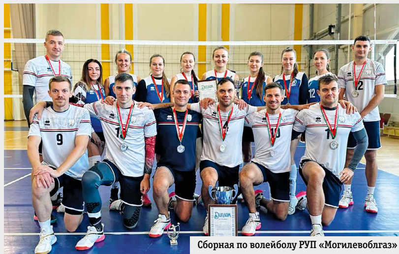
Сборная по волейболу РУП «Могилевоблгаз»

Представители команд объединения «Белтопгаз» вошли в число лучших игроков, отмеченных в индивидуальных номинациях.